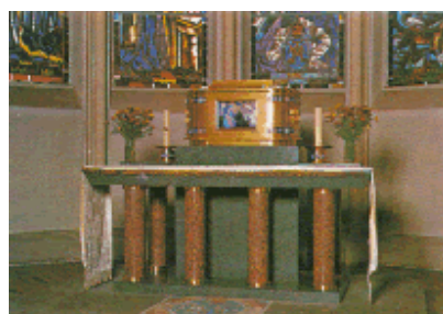
El relicario de Champagnat

Murió el 6 de junio de 1840, sólo tenía 51 años, pero ya había consumado su misión y crecido a una gran talla espiritual.